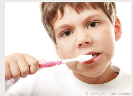
Bei der Prophylaxe lernen Ihre Kinder die richtige Zahnpflege.

Es gibt also keinen Grund, warum Sie auf Prophylaxe für Ihre Kinder verzichten sollten.