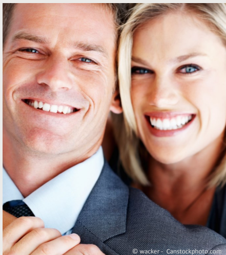
Selbstsicher mit gepflegten Zähnen

Dann werden Mund, Zähne und Zahnfleisch untersucht. Die Zahnbeläge werden angefärbt, um sie besser sichtbar zu machen und es wird die Tiefe der Zahnfleischtaschen gemessen.