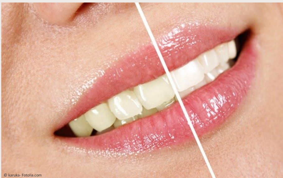
Deutlicher Unterschied: Professionelles Bleaching beim Zahnarzt wirkt!

Vertrauen Sie Ihre Zähne besser Profis an!