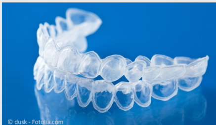
Bleaching-Form aus Kunststoff, in die Sie das Aufhellungs-Gel einfüllen.

Beim Home-Bleaching werden vom Zahnarzt dünne flexible Formen aus einem transparenten Kunststoff hergestellt, die genau auf Ihre Zähne passen (siehe Foto).