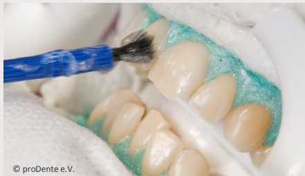
Power-Bleaching beim Zahnarzt: Auftragen des Bleaching-Gels

Wenn Sie die Praxis wieder verlassen, können Sie sich an sichtbar helleren Zähnen freuen!