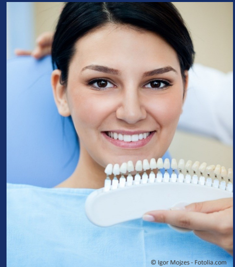
Bleaching vom Zahnarzt: Gewinnendes Lächeln mit strahlend weißen Zähnen

Dunkle Zähne können ein ziemliches Ärgernis sein: Obwohl sie sauber geputzt sind, wirken sie einfach nicht hell. Die Folge ist: Man traut sich oft nicht mehr, unbefangen zu reden und zu lächeln. Man achtet darauf, dass andere die Zähne nicht sehen. Und wenn man fotografiert wird, lässt man den Mund lieber zu. Das muss nicht sein: Zähne können heute mit bewährten Methoden wieder aufgehellt werden. Professionelles Bleaching beim Zahnarzt kostet nur wenige Hundert Euro. Aber das neue Lebensgefühl ist unbezahlbar!